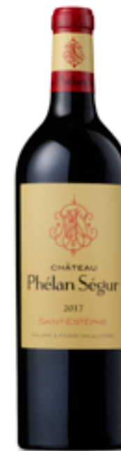
VIN ROUGE Phélan Ségur 2017