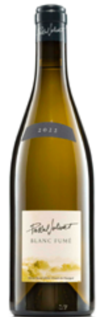
VIN BLANC Blanc Fumé de Pascal Jolivet 2022