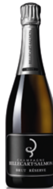
CHAMPAGNE Billecart Salmon